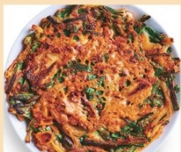
ミックスチヂミ 880円