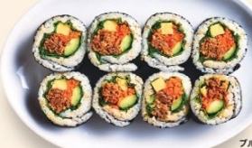
ブルコギ海苔巻き