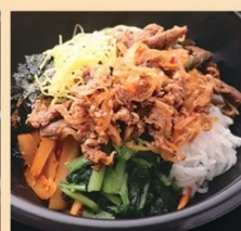
ブルコギビビンバ丼 900円