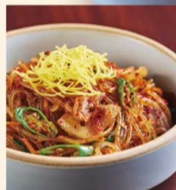
ピリ辛チャプチェ