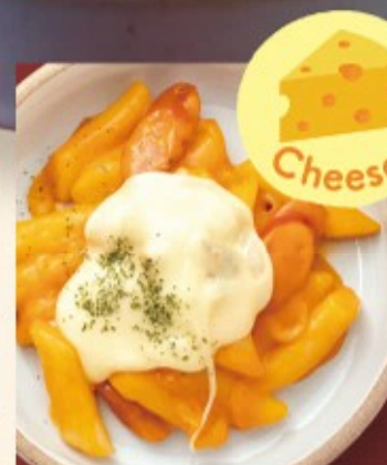
チーズロゼトッポギ