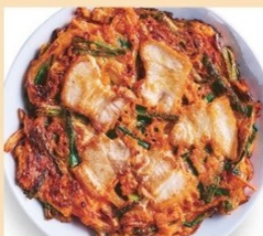
豚キムチチヂミ 680円