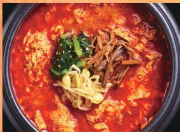
ユッケジャンスープ 1,180円

プリプリホルモンが入った 旨味あふれる絶品スンドゥブチゲ! ホルモンスンドゥブチゲ 1,180円