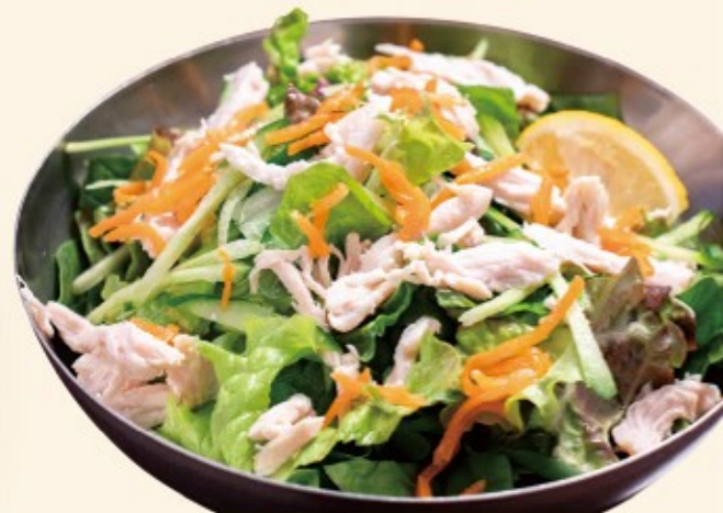
蒸し鶏の塩チョレギサラダ