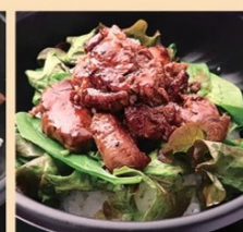
サイクロステーキ丼 1,280円