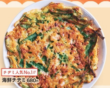
チヂミ人気No.1!! 海鮮チヂミ 680円