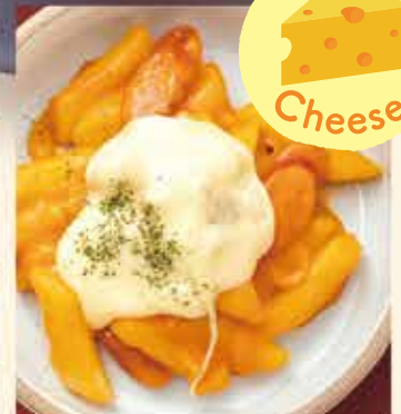
チーズロゼトッポギ