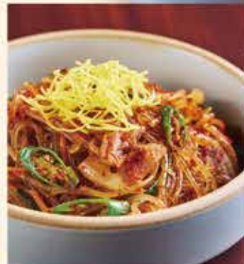
ピリ辛チャプチェ