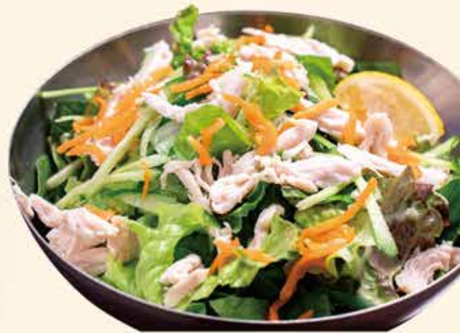
蒸し鶏の塩チョレギサラダ