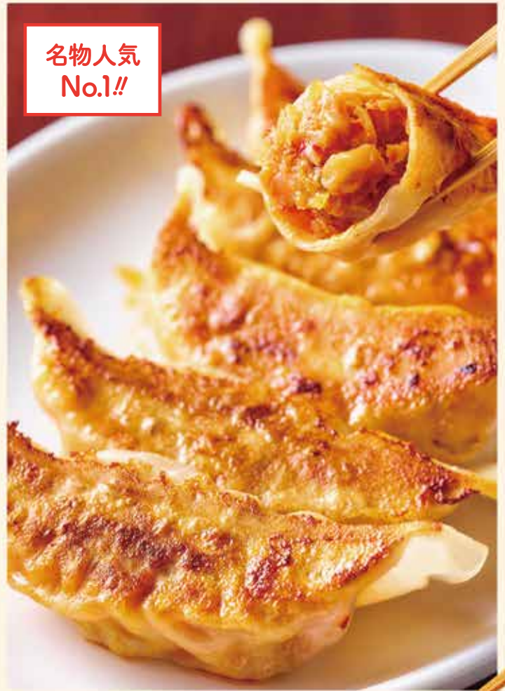
自家製キムチ餃子